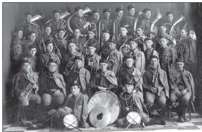
Poněkud větší hudební těleso bylo založeno roku 1925. Byl to trubačský sbor Sokola Třebíč, jako základ pozdější dechové kapely. V tomto dechovém orchestru se na konci třicátých let soustředilo na 50 hráčů a stal se tak největším sokolským dechovým tělesem!