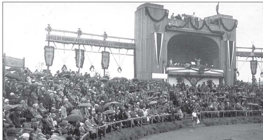
Západní tribuna sokolského stadionu s hudebním pavilonem při slavnostním zahájení Švecova župního sletu v roce 1933. Celý stadion i s tribunou byl vystavěn o rok dřívě. Stála až do roku 1977, kdy ji podpálili neznámí vandalové.