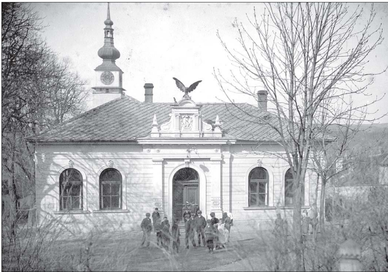
Třebíčská sokolovna. Pohled, který dodnes bere u srdce nejen staré sokoly.